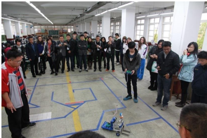
中國浙江參訪活動