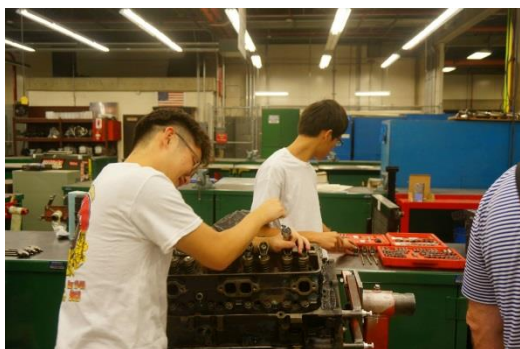
同學進行汽車機件之拆解實習