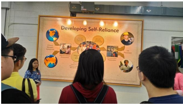
同學認真地體驗當地的文化