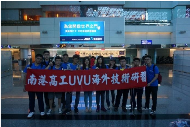
103 年度南港高工 UVU 海外技術研習團，7 月 28 日出發至美國，為臺北市首所辦理 SIEP 工業技能國際教育之高工

在同學們所建置的臉書上，看到研習互動過程中，充滿學習的樂趣及同學認真學習及體驗，正如同學的留言，「雖然有很多不捨，但永遠不會忘記」。