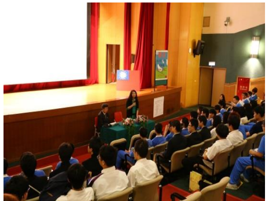
日本學校交流校長與學校代表致詞情形