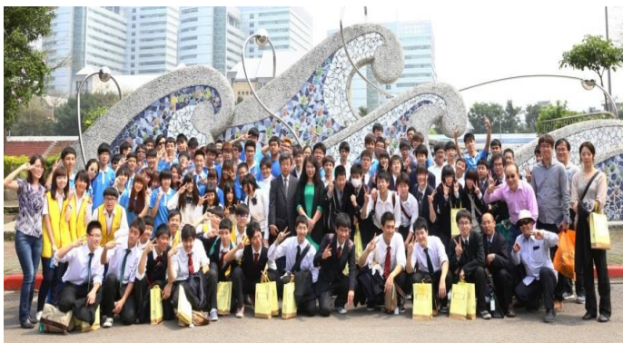
日本學校交流活動大合照

最後，趁著晴朗的好天氣，雙方齊聚在本校公共藝術作品「前浪後浪」的前面，進行團體大合照，為整個參訪行程畫下完美的句點。